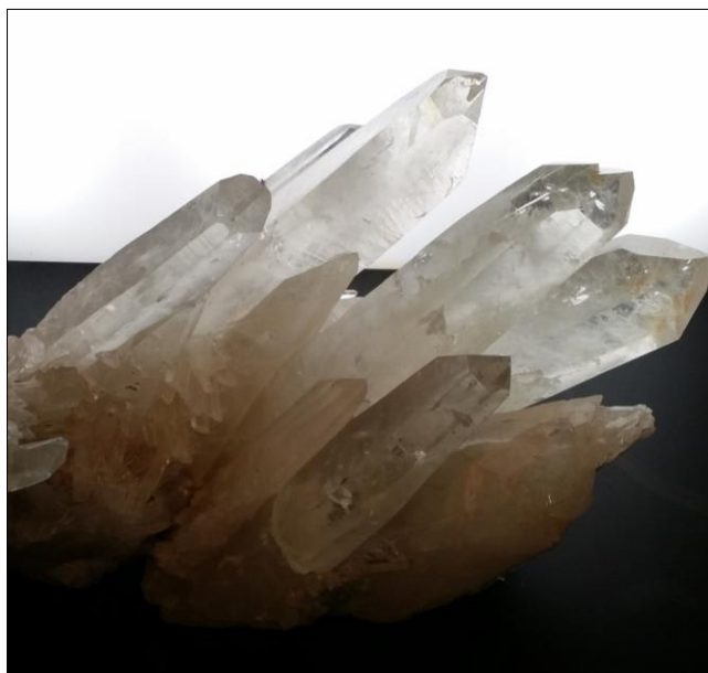
Foto van Annemieke Solleveld, genomen in het South Australia Museum in Adelaide.

Leden met een e-mailadres, ontvangen de Kanttekeningen elektronisch. Dit scheelt veel geld aan porto. U kunt uw e-mailadres doorgeven aan Annemieke Solleveld. Beschikt u niet over email, dan ontvangt u de 'Kanttekeningen' via de post.